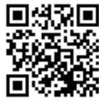
表現の自由を守る会 QRコード