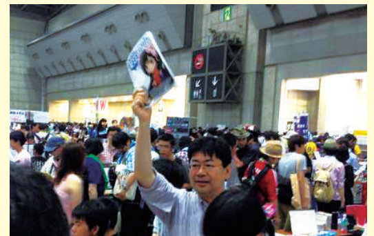
AFEF(エンターテインメント表現の自由の会)のブースにて