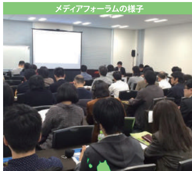
メディアフォーラムの様子